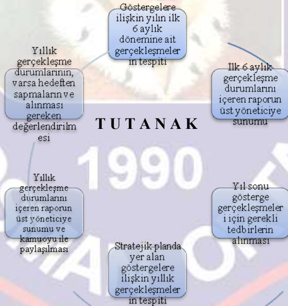
Şekil 3 İzleme ve Değerlendirme Döngüsü